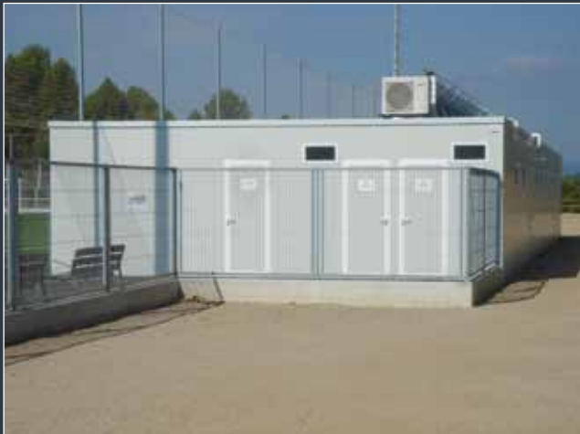
La construcción modular incluye cualquier elemento de la tradicional: estructura, aislamiento, ahorro energético, etc. Imagen de los vestuarios del Campo de Fútbol de Gelida (Barcelona), de 220 m 2 .