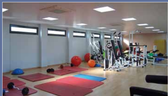
Vestuario de equipo (imagen superior), sala de masajes y recuperación (imagen central) y gimnasio (imagen inferior) de la Ciutat Esportiva F.C. Barcelona, en Sant Joan Despí, de 1.050 m 2 .