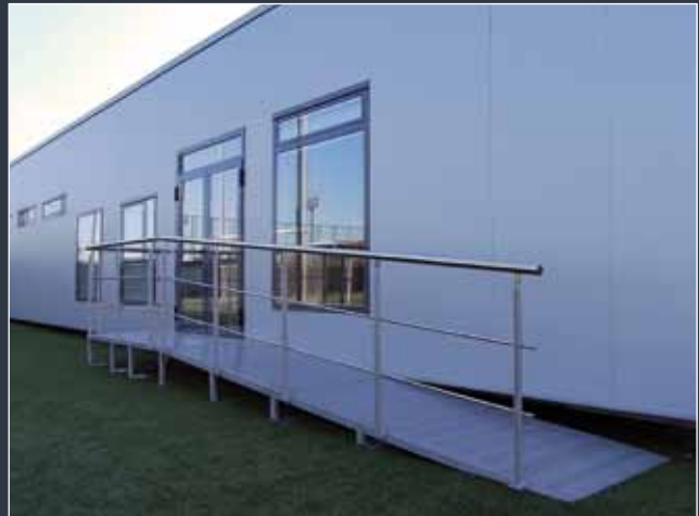
La construcción modular se adapta a cualquier necesidad, cumpliendo siempre con la normativa. Imagen de los vestuarios de la Ciutat Esportiva F.C. Barcelona, en Sant Joan Despí, de 1.050 m 2 .

En ese sentido, las dimensiones y grosores de los elementos utilizados en la fabricación de los módulos varían en función de las especificaciones estructurales y de las solicitudes de carga a las que se ha de someter cada edificio.