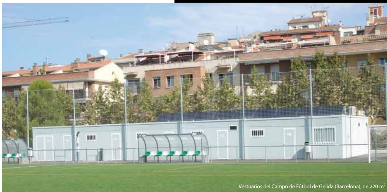
Vestuarios del Campo de Fútbol de Gelida (Barcelona), de 220 m 2 .

La edificación modular es, a día de hoy, una innovadora y moderna técnica constructiva que aglutina las principales virtudes de la hasta ahora edificación tradicional y que aporta importantes ventajas frente a esta. La construcción modular no solo es más flexible, económica y garantiza los mismos niveles de calidad que las construcciones tradicionales, sino que se convierte en la solución ideal para cualquier sector, ya sea de forma temporal o definitiva. El cambio se extiende a las aplicaciones, ya que las estructuras prefabricadas se destinan a múltiples usos, llegando incluso a transformar lo temporal en estético y duradero. El mundo del deporte tampoco es ajeno a esta alternativa.