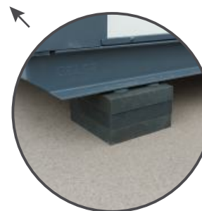
Placas de alta resistencia